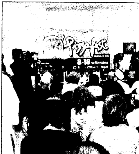
La conferenza di presentazione di Pizzafest

La manifestazione durerà fino a domenica 18