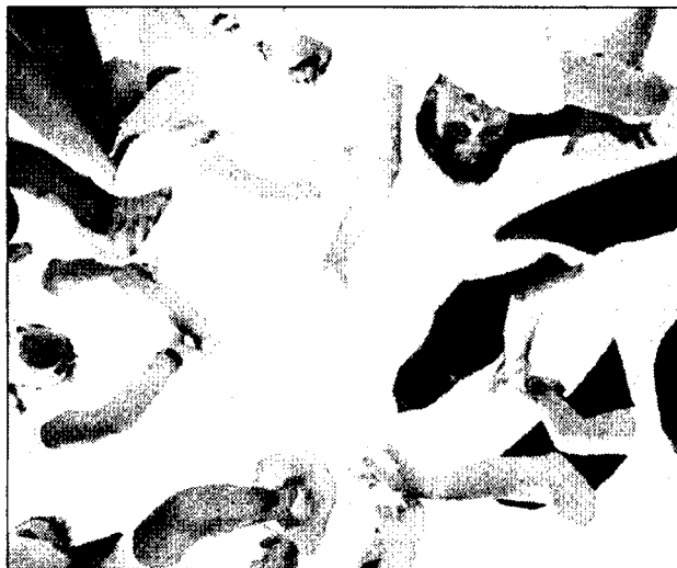
Pizzaioli «acrobatici» alla scorsa edizione del Pizzafest

Musica e allegria da domani sera al Pizzafest, l'evento che fino al 18 settembre sarà alla Mostra d'Oltremare. E c'è una notizia: la pizza napoletana avrà presto una tutela internazionale: per essere conforme ai canoni tipici della ricetta tradizionale italiana, dovrà essere realizzata secondo le modalità previste nel disciplinare della Stg. In questi giorni gli uffici di Bruxelles dell'Ue hanno inviato al ministero delle Politiche Agricole il protocollo conclusivo dell'istruttoria.