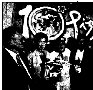
La presentazione dell'evento

serata saranno riaccompagnati con lo stesso mezzo fino a piazza Municipio, punto da dove erano partiti. Sconto di 1 euro anche per chi lunedì, martedì e mercoledì utilizzerà i trasporti pubblici per raggiungere il Pizzafest, con l'esibizione del biglietto timbrato: 1.50 euro in meno per chi ha l'abbonamento annuale, mostrandolo all'ingresso. Molti gli eventi collaterali in calendario, di particolare rilievo la serata del 13 settembre, l'omaggio ad Aurelio Fierro che quest'anno avrebbe